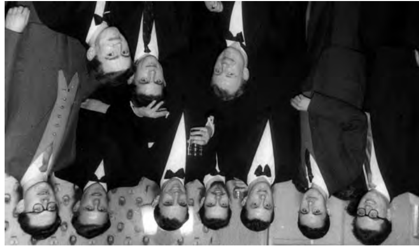
Fin de curso con sus alumnos, Universidad de Nottingham, 1959