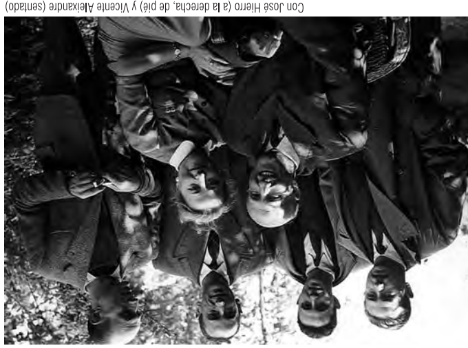
Con José Hierro (a la derecha, de pie) y Vicente Aleixandre (sentado)

En Madrid participa en las revueltas estudiantiles entre el 1 y el 9 de febrero lo que tiene como consecuencia su detención y posterior vigilancia policial en Zamora.