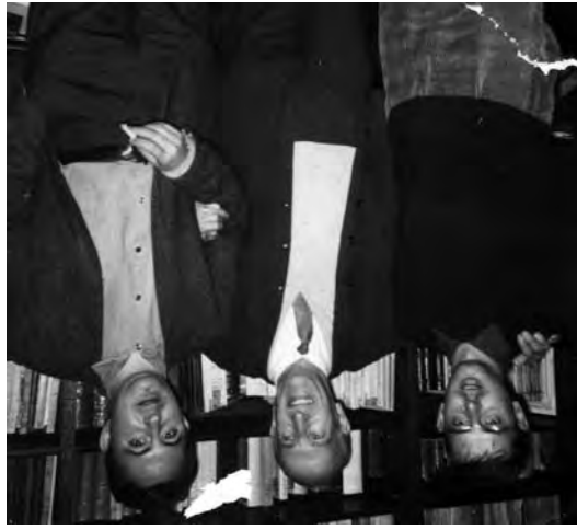
José Ángel Valente, Vicente Aleixandre y Claudio Rodríguez, 1967